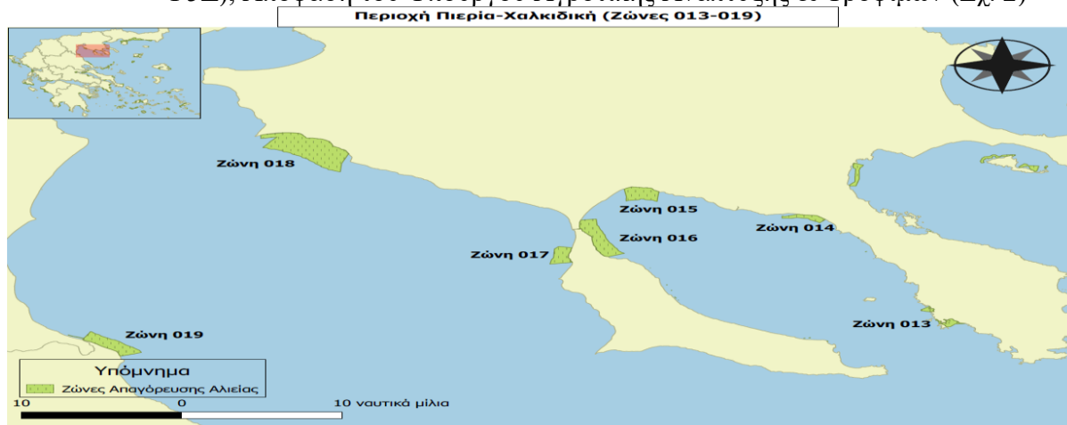
Σχήμα 2: Ζώνες

Απαγόρευσης Αλιείας Περιοχή Πελοπόννησος-Χαλκιδική (Ζώνες 013-019)