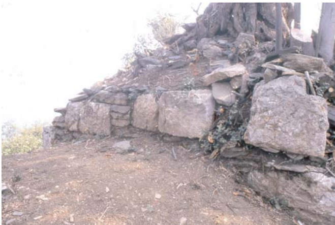
Λεπτομέρεια του τείχους της Ακρόπολης

Οι πληροφορίες των αρχαίων πηγών, όταν δεν συνδυάζονται με την αρχαιολογική βάση, με σαφείς αρχαιολογικές ενδείξεις δηλαδή, κάνουν τα πράγματα πολύ δύσκολα. Και ακόμη, όταν η αναφερόμενη περιοχή καλύπτεται από πυκνή δασώδη βλάστηση, όπου δεν υπάρχει γεωργική δραστηριότητα, το θέμα περιπλέκεται ακόμα περισσότερο. Οι απόψεις των διαφόρων επιστημόνων, απόλυτα τεκμηριωμένες, σύμ-