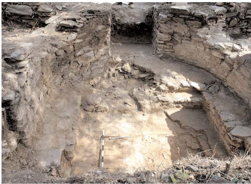
7. Κάστρο Βελίκας. Το ιερό Βήμα της εκκλησίας.

κής, ενώ τα συσχέτισε με τα παλαιοχριστιανικά ευρήματα της παραλιακής περιοχής (οικόπεδο Καλαγιά).