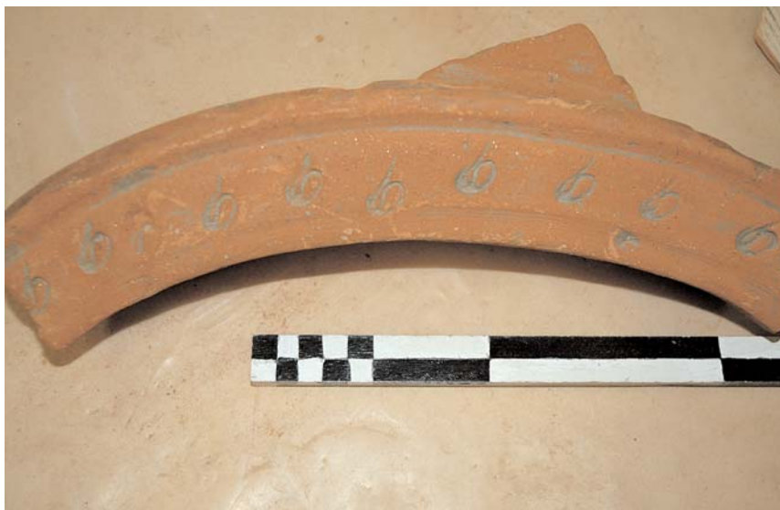
18. Βελίκα, χείλος πύλου

Ο πληθυσμός της παλαιοχριστιανικής Μελίβοιας σχηματίζει σταδιακά τους ημιορεινούς οικισμούς Άλλη Χώρα, Μικρή και Μεγάλη Θανάτου και άλλους μικρότερους στον Κούτζιμπο, που απορροφήθηκαν τελικά στη Μεγάλη Θανάτου, τη σημερινή Μελίβοια 32 .