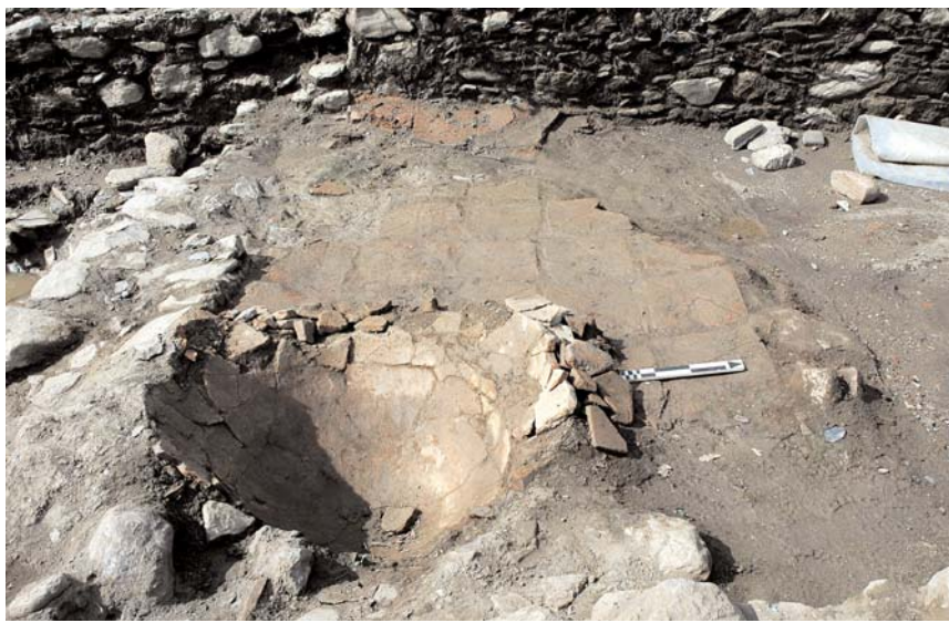
14. Βελίκα, δυτική πτέρυγα με το πήλινο δάπεδο.

Η σημασία του ερευνηθέντος συγκροτήματος αυξάνεται αν συνεξετασθεί το γεγονός ότι είναι το πρώτο παλαιοχριστιανικό κτί-