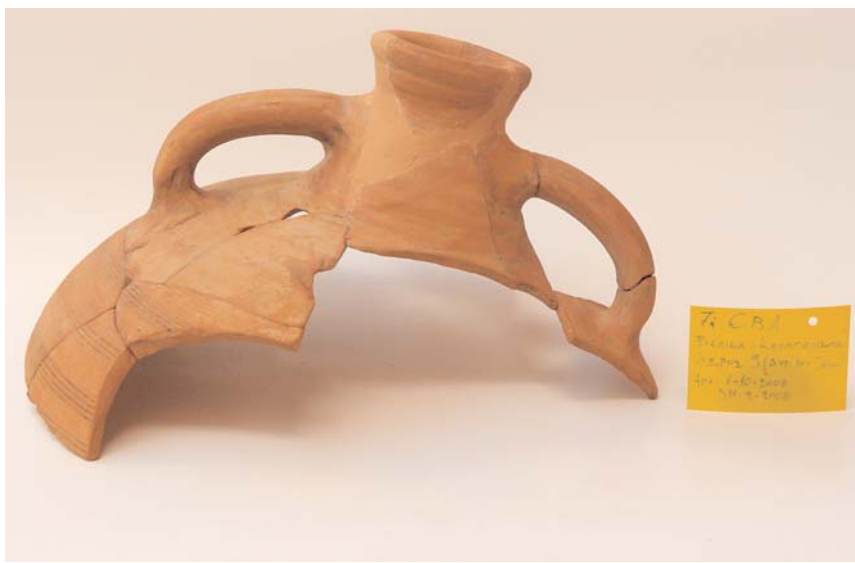
16. Βελίκα, αμφορέας

αυξημένη σημασία της παράπλευρης διαδρομής τα τελευταία χρόνια, όταν αναφέρονται πολλές σλαβικές εγκαταστάσεις