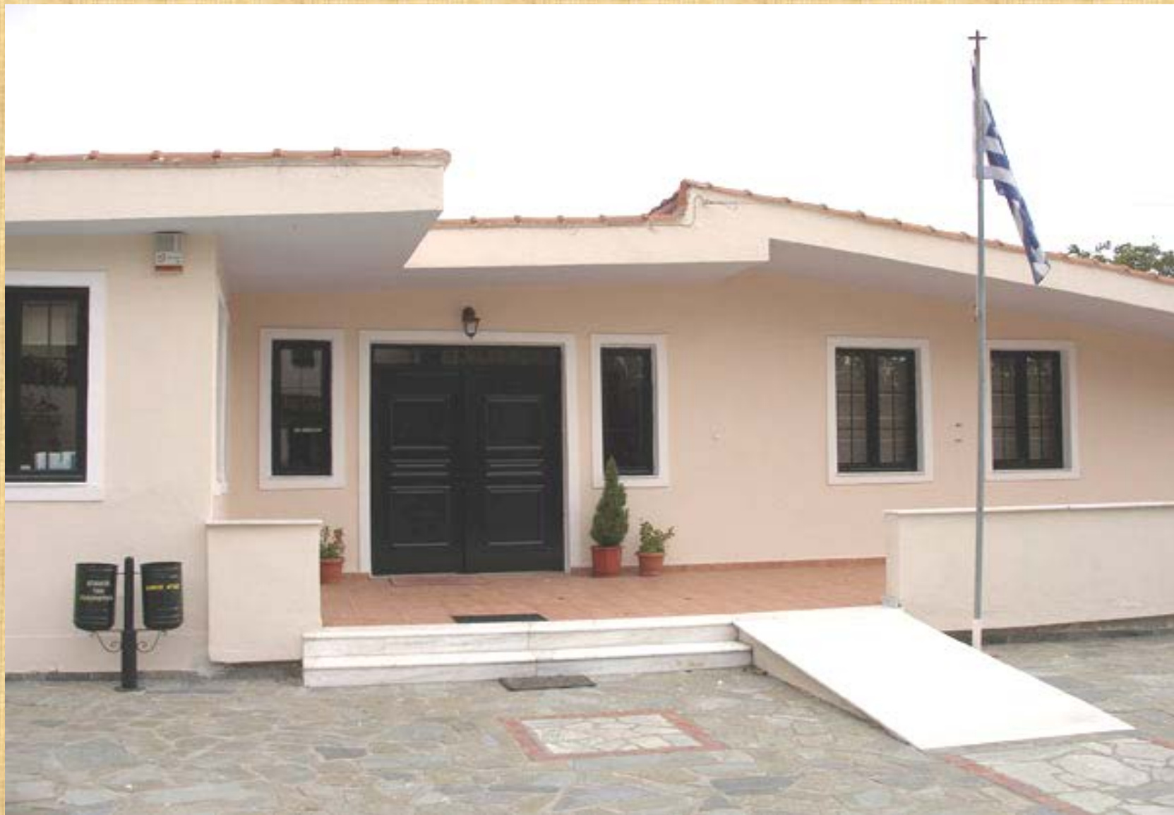
GENERAL STATE ARCHIVES OF AGIA