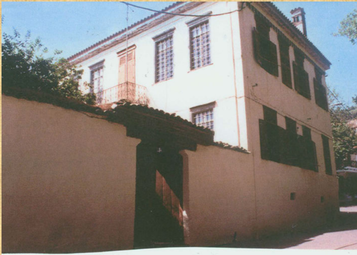
MANSION OF E. BATZIAS