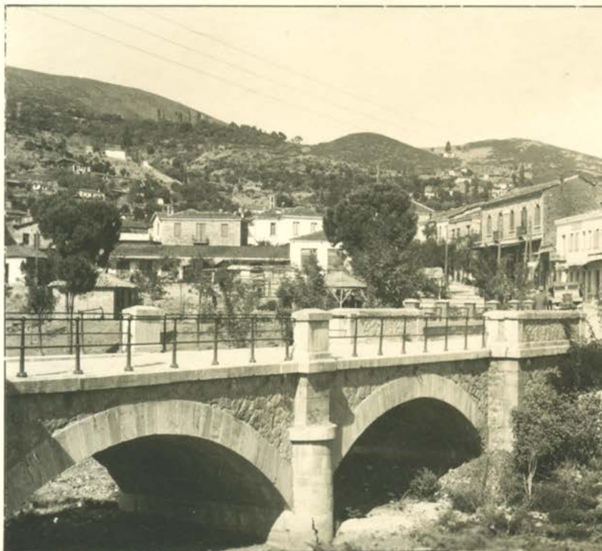
389, Από τις Θεσσαλικές Όμορφιες, Άχιό,