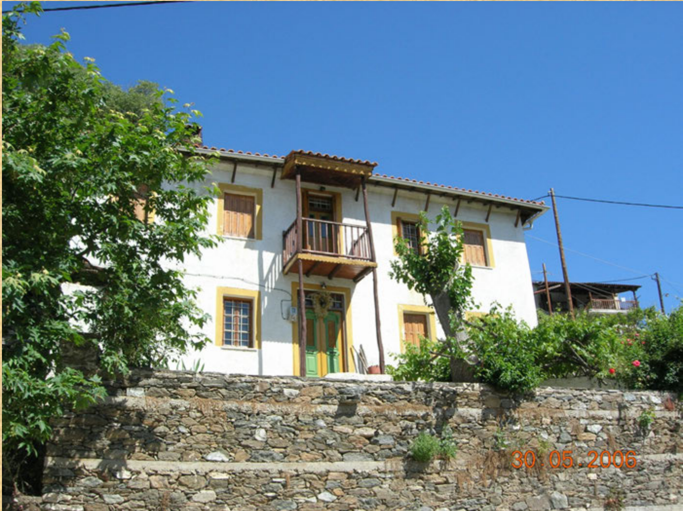
Mansion in Metaxohori