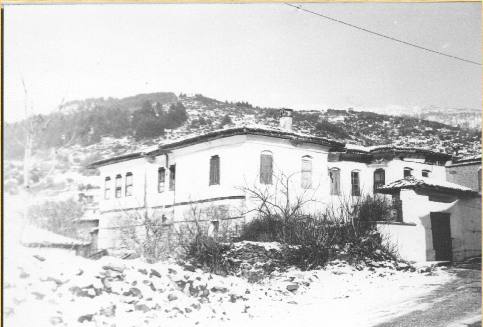
MANSSION OF FAMILY ALEXOULIS