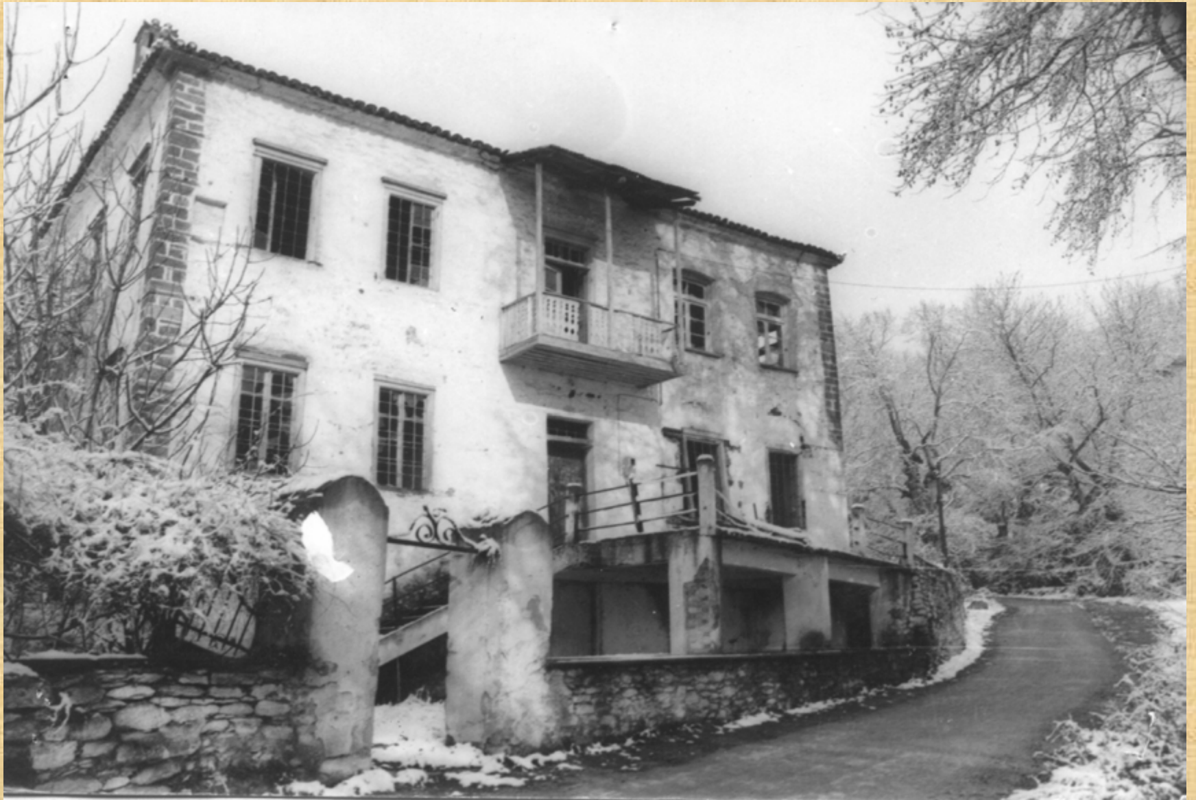
The Girls School in Metaxohori