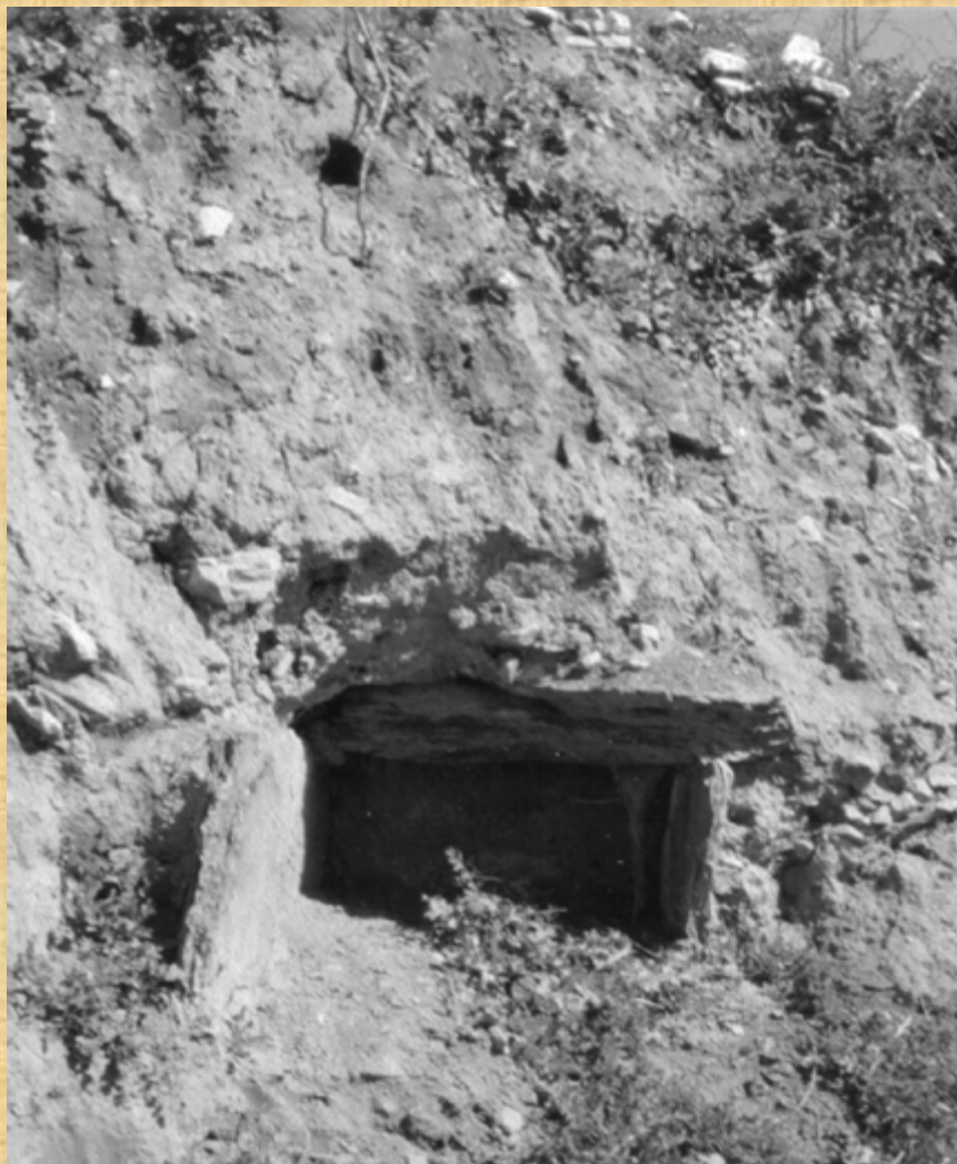
HERMITAGE OF ST. ANARGYROI