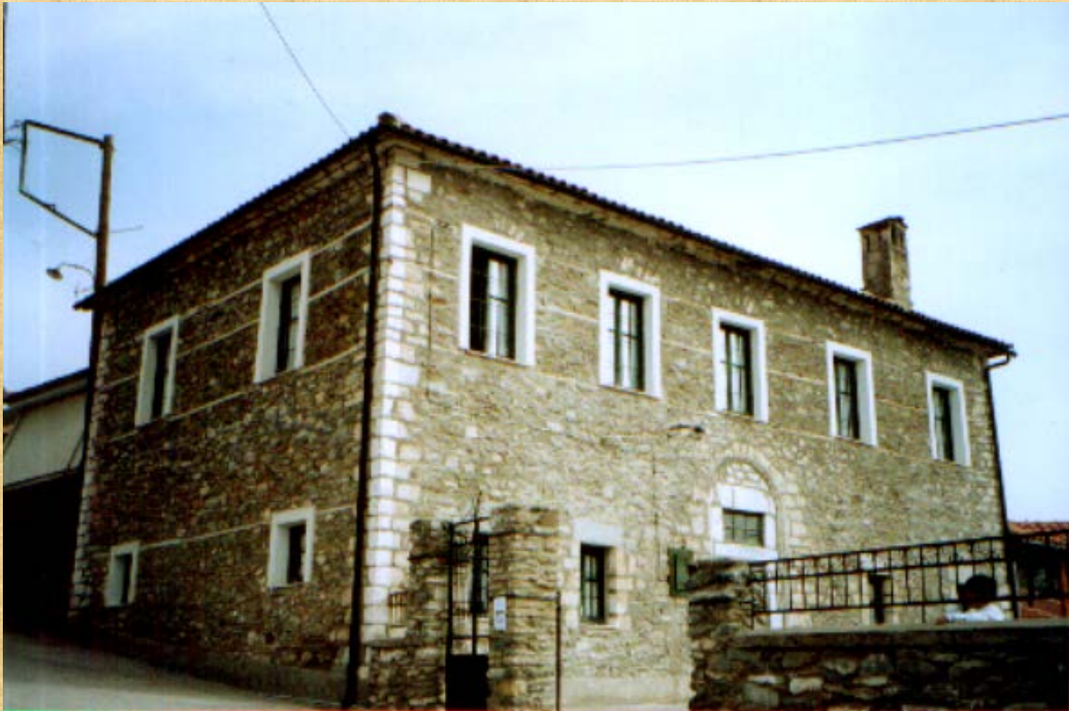
GREEK SCHOOL OF AGIA