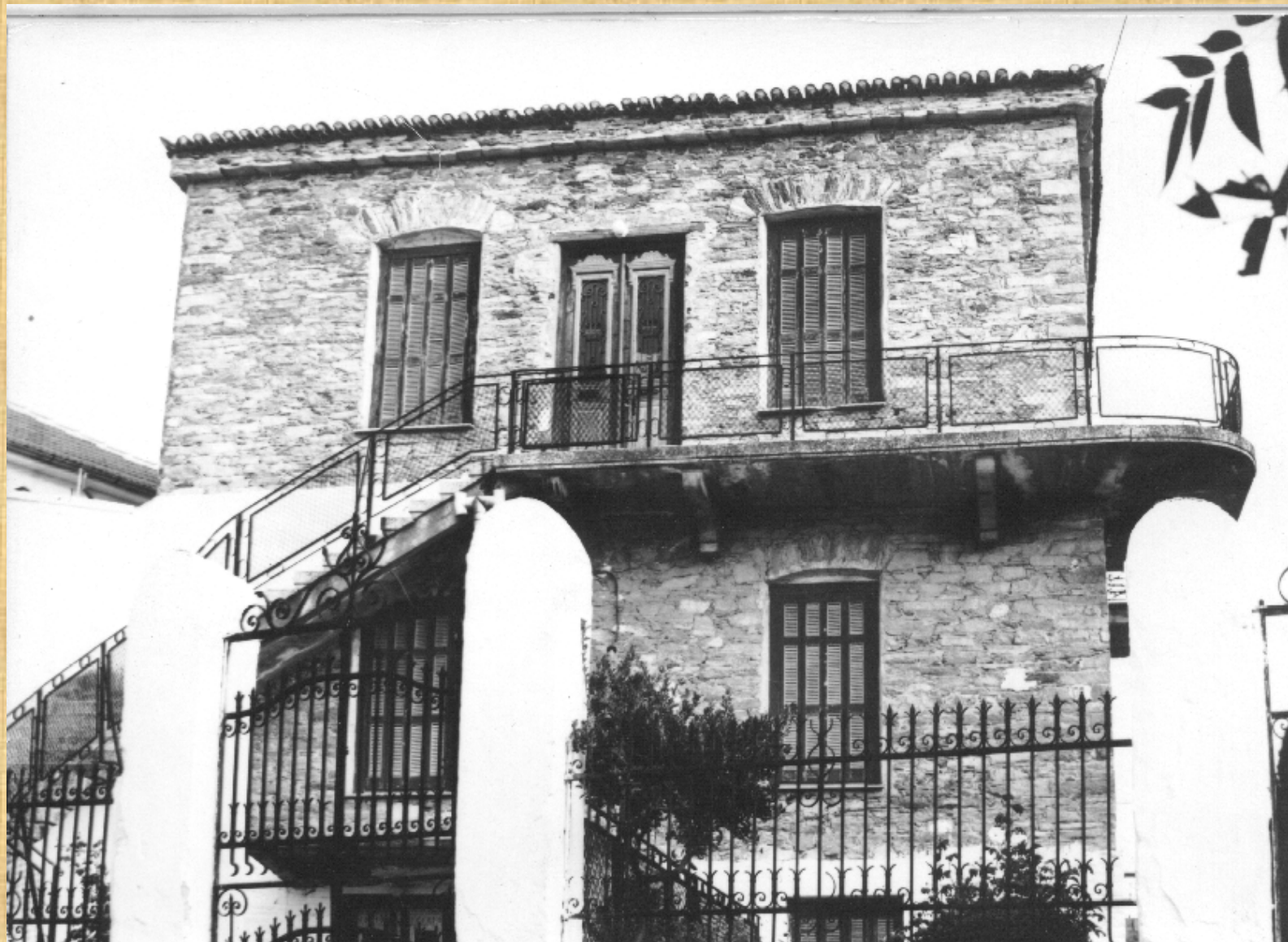
Mansion in Agia