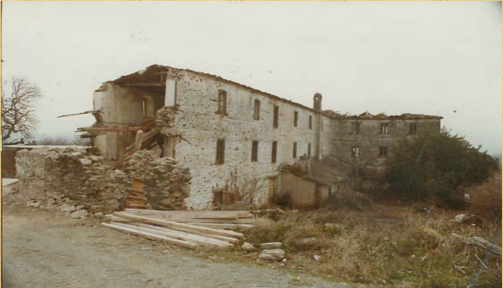
Mansion of Favre