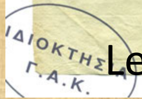
Letter of merchants of Agia (1799)

Handwritten signature or name, possibly "Lazaros" or similar, written in a cursive style.