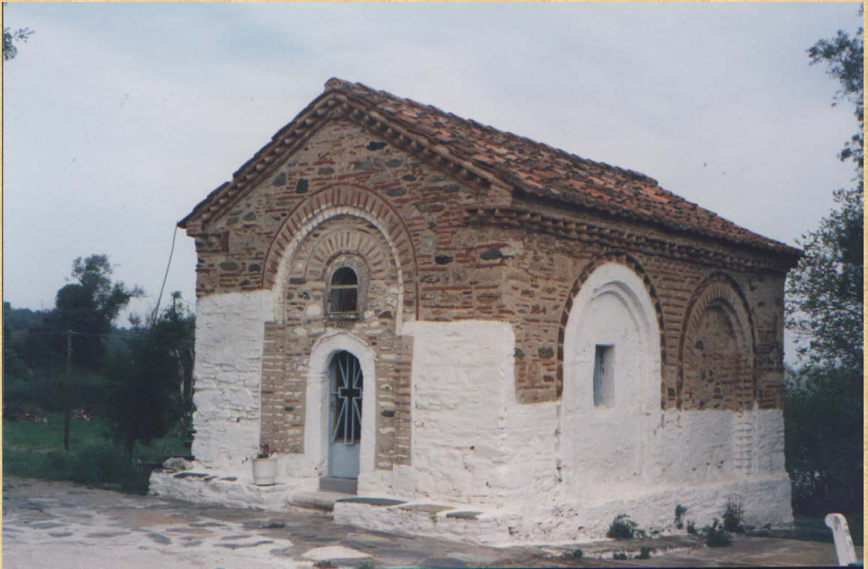
H.C. PANAGIA OF VELIKA (12 th century)