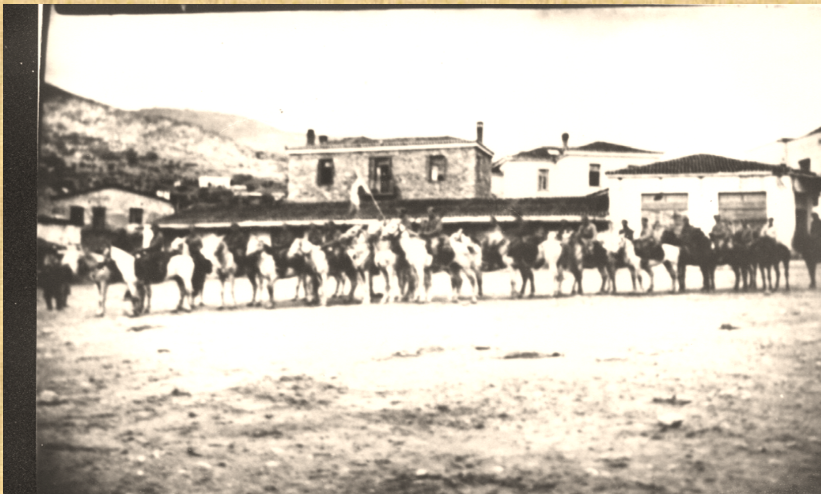
E.L.A.S (Greek Popular Liberation Army) in Agia 1944