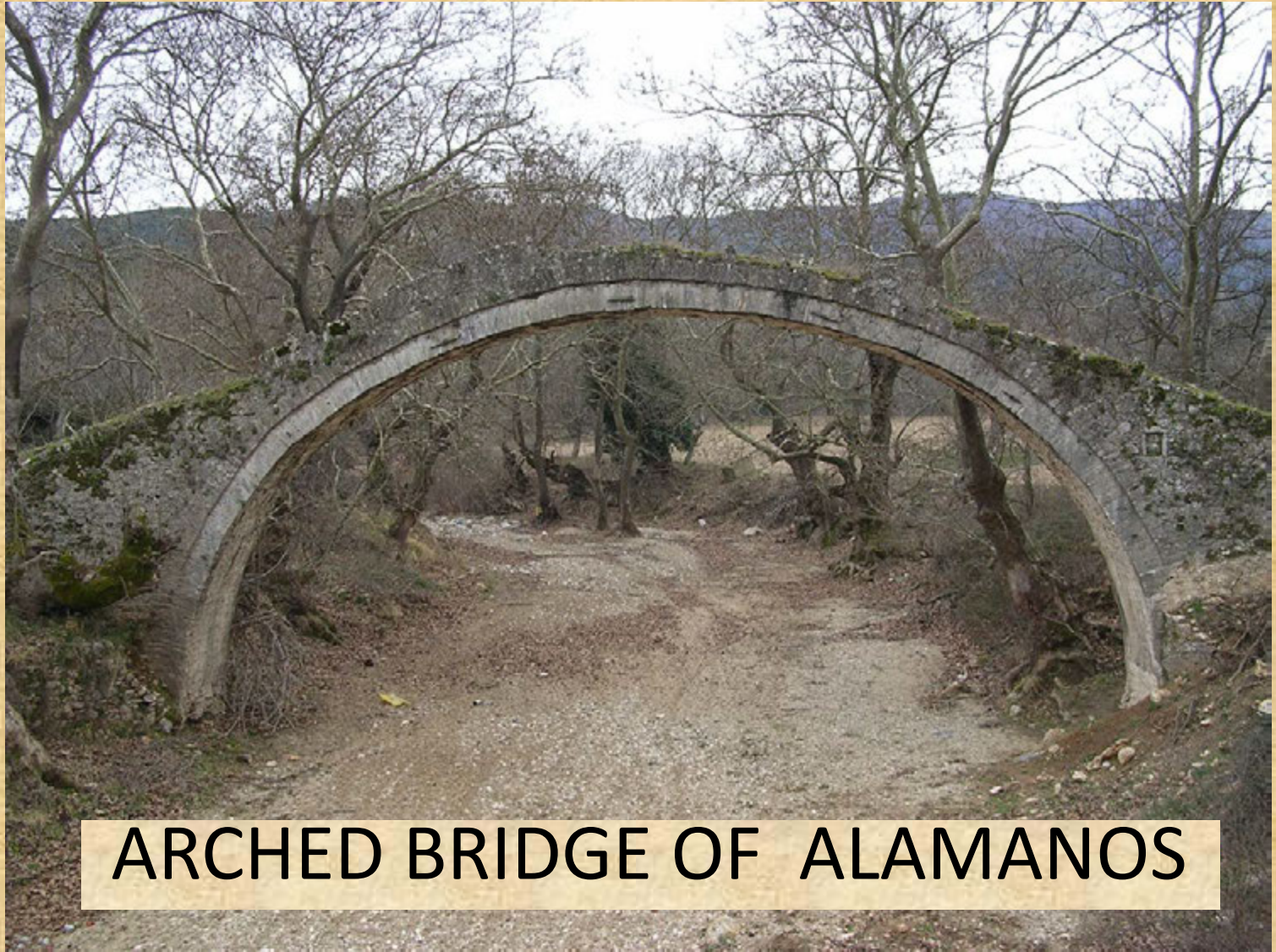
ARCHED BRIDGE OF ALAMANOS