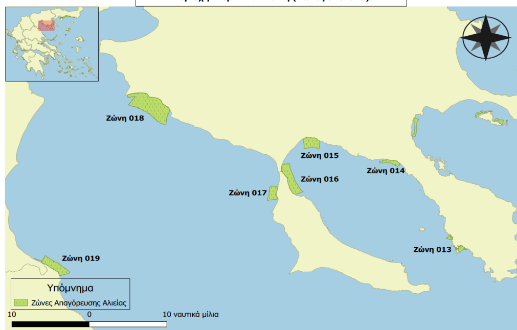
Σχήμα 2: Ζώνες Απαγόρευσης Αλιείας Περιοχή Περία-Χαλκιδική (Ζώνες 013-019)