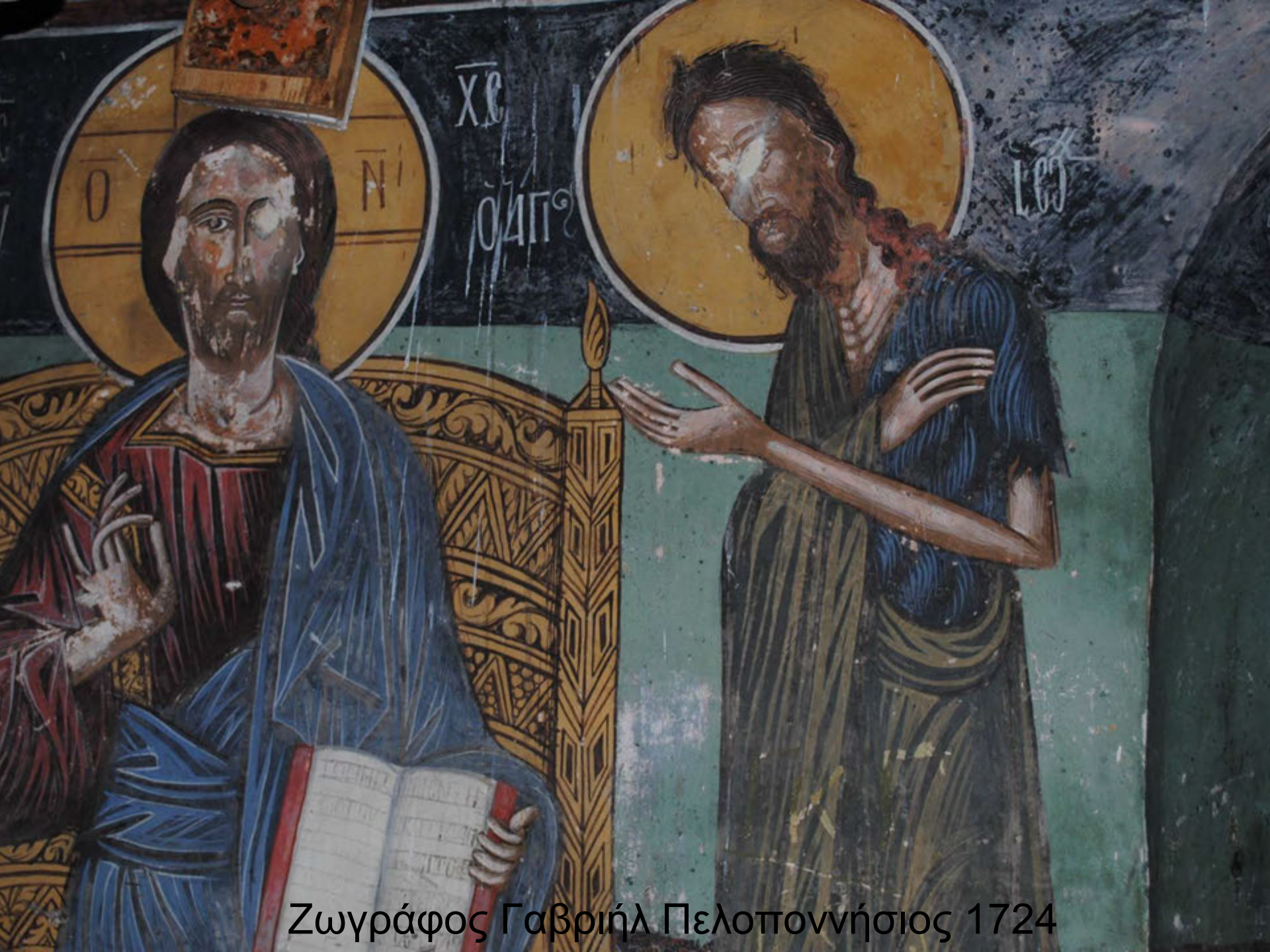
Ζωγράφος Γαβριήλ Πελοποννήσιος 1724