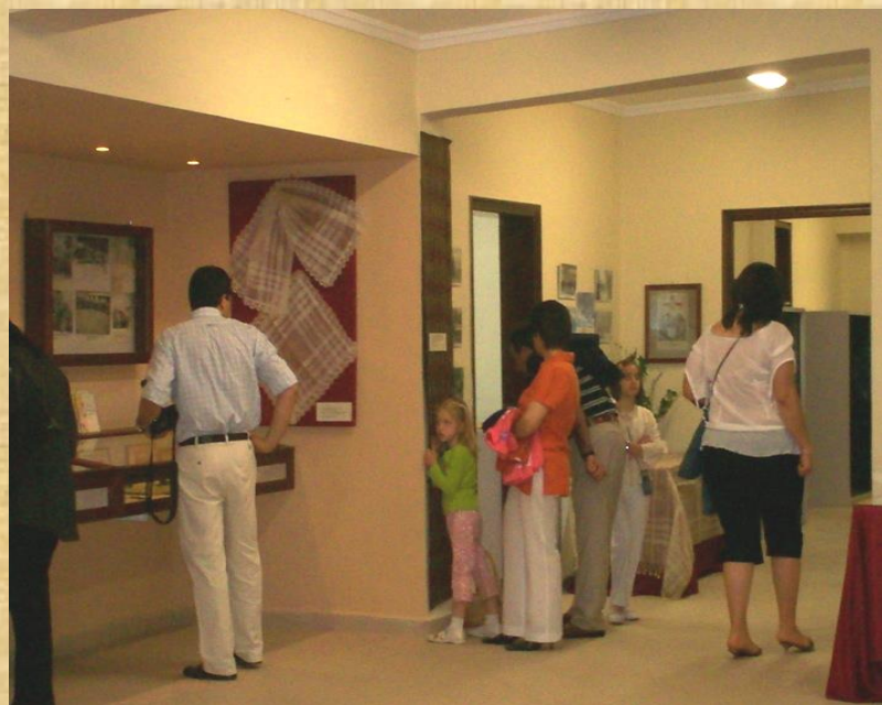
Έκθεση «Το Μεταξοχώρι και τομετάξι» Ιούνιος 2006