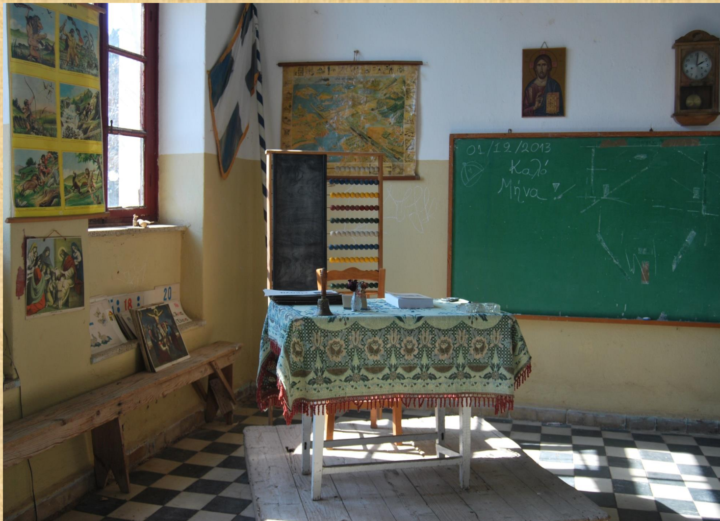
The old school of Megalovriso