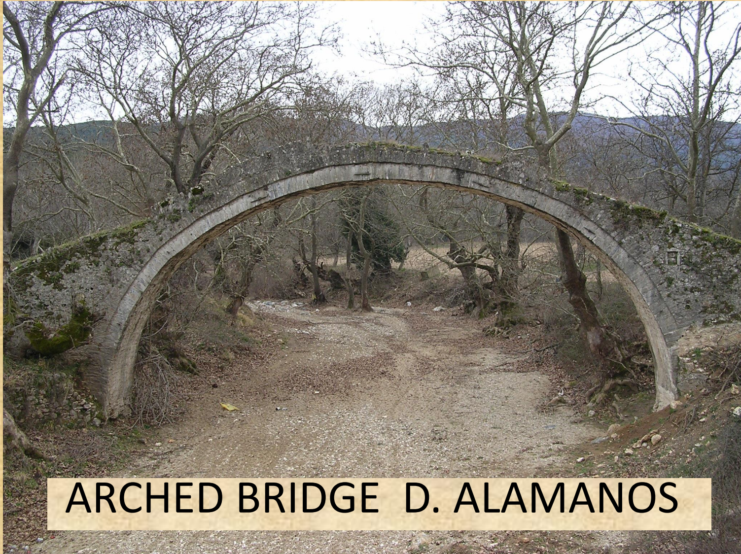
ARCHED BRIDGE D. ALAMANOS