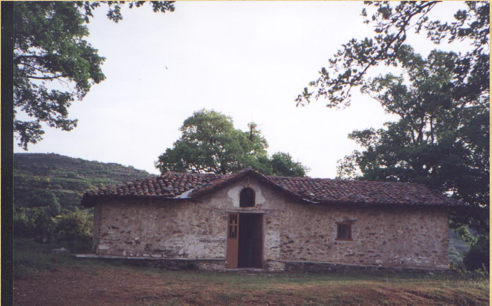
Church of S. Ioannis