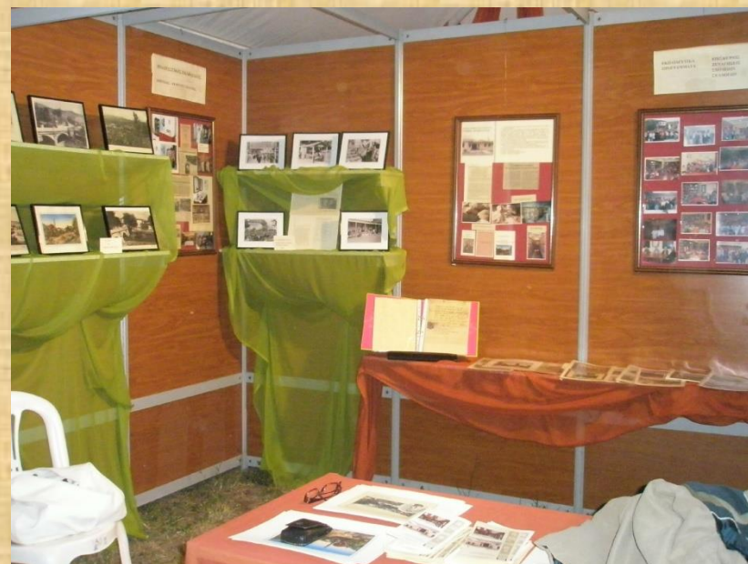
Έκθεση στη «Γιορτή του Μήλου» Σεπτέμβριος 2009