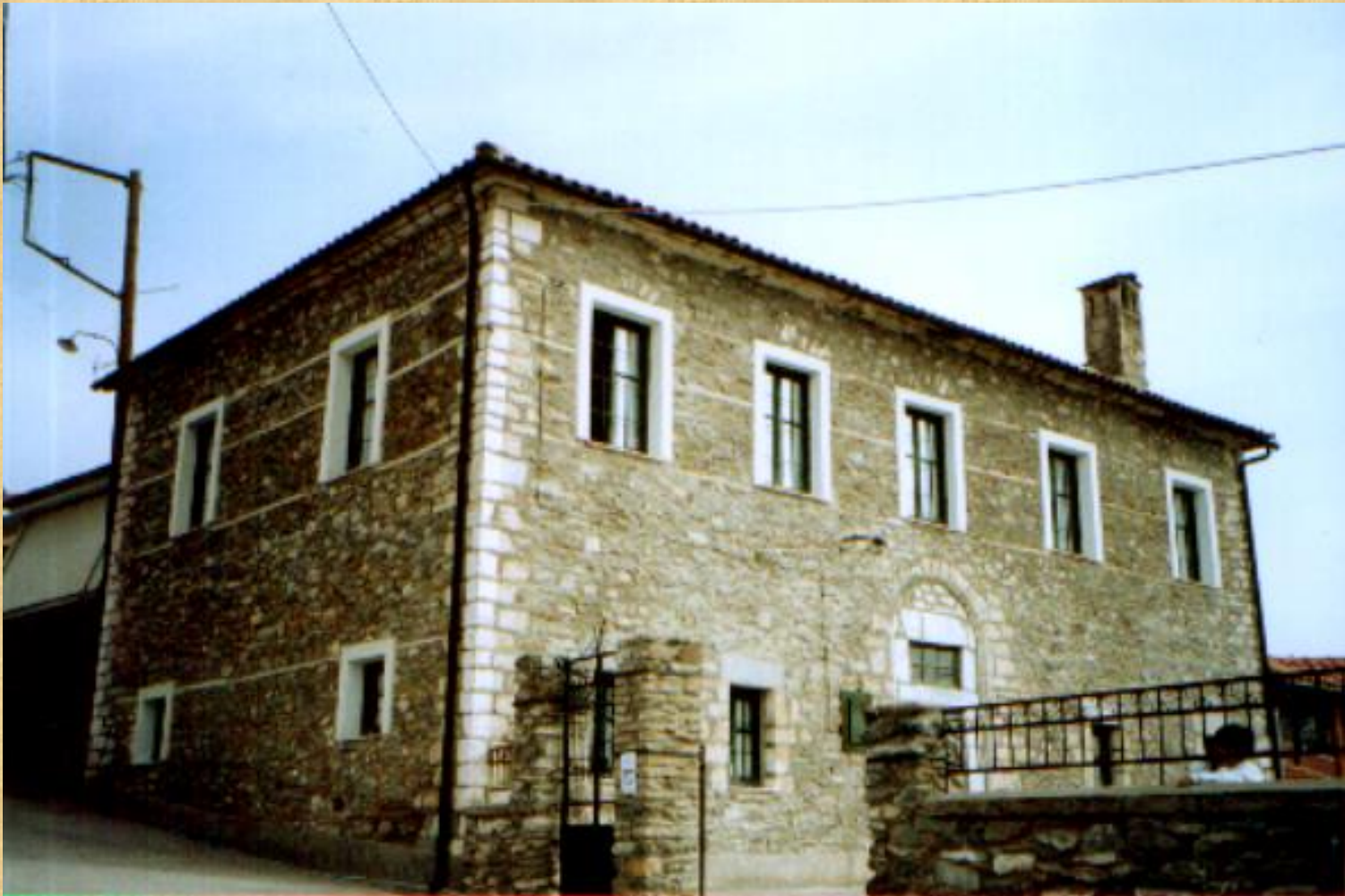
GREEK SCHOOL AGIAS 1879