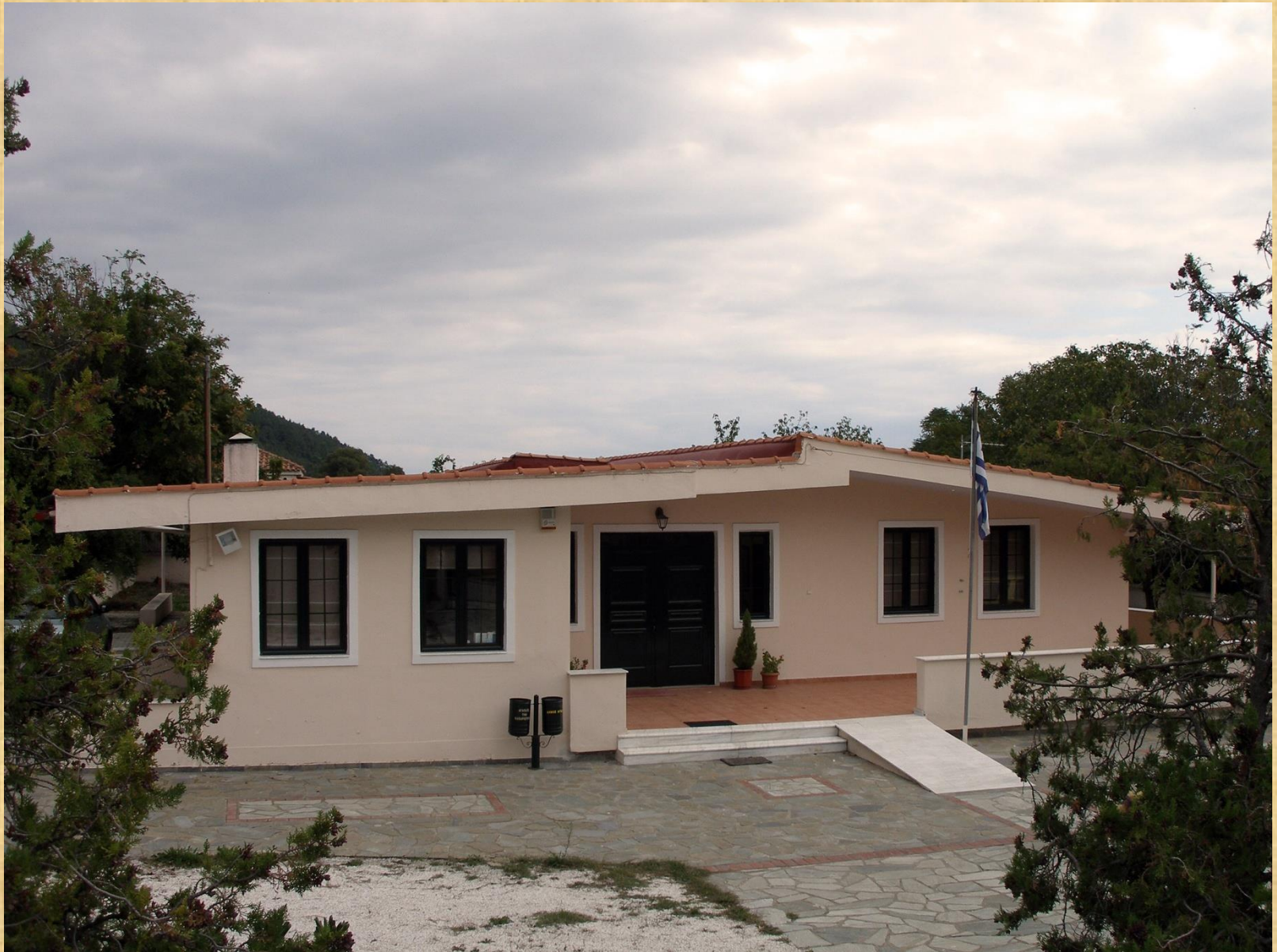
GENERAL STATE ARCHIVES OF AGIA